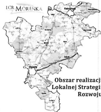
Obszar realizacji Lokalnej Strategii Rozwoju

„Jeden pomysł, tysiące inicjatyw” - zbierając, agregując i podsumowując działalność podjęto ostatnich latach można uznać, że idea jaka przyczyniła się do powstania (jeden pomysł) przyczyniła się do setek, a może i nawet tysięcy inicjatyw, które w tym okresie zostały zrealizowane w regionie, LGR było tym podmiotem, który inicjował, wspierał bądź uczestniczył w ich realizacji.